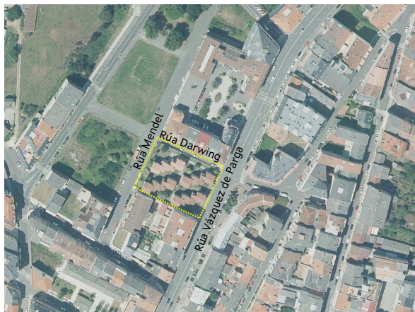
Ámbito do plan especial de reforma interior nº2

O ámbito limita polo norte coa rúa Darwin, polo leste coa rúa Vázquez de Parga, polo sur con parcelas con edificacións residenciais colectivas de 5 alturas en medianeira inseridas no mesmo cuarteirón, e polo oeste coa rúa Mendel. Está conformado por dúas parcelas catastrais: a que acolle as casas dos mestres -de titularidade municipal- e outra, de 18 m 2 e situada no extremo sueste, onde se empraza un transformador eléctrico.